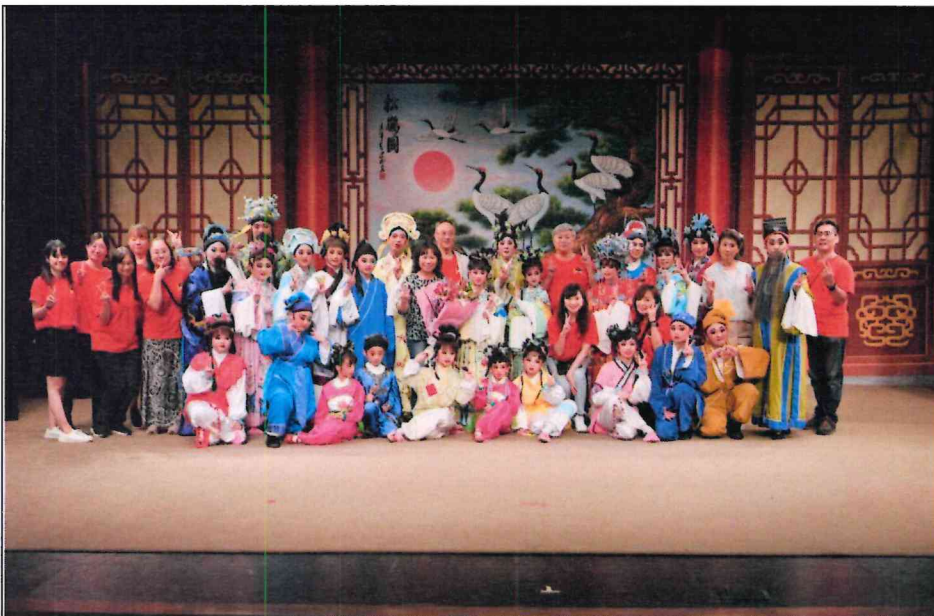
2024. 5. 26 台北市安西媽祖協會舉辦「媽祖邀請大家來看戲」活動，邀請全省13尊媽祖及大稻埕城霞海城隍爺進戲苑看戲演出「義女情」