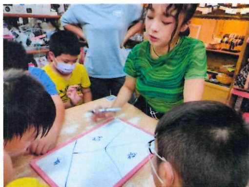
彩繪大冒險：設計我的社區夢想