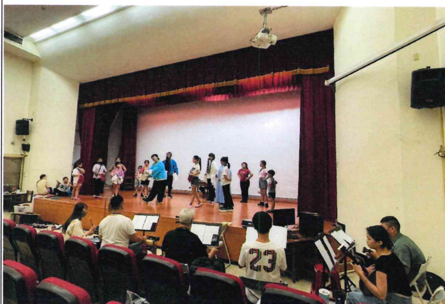
平日社團上課排練情形