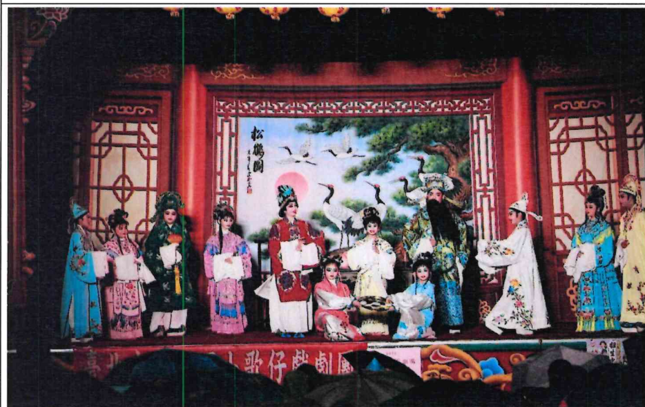
年度社團成果展演_2024. 7. 4 臺北市大稻埕戲苑【陳三五娘】