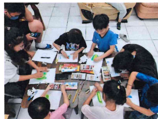
奇妙的甲蟲觀察與創作