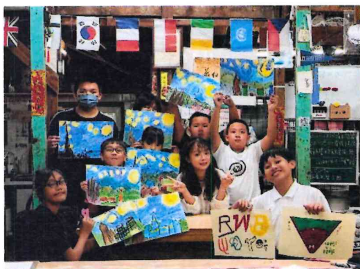
星空下的創作：梵谷與社區夜空