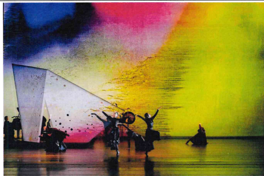
第三幕《比西里岸之夢》