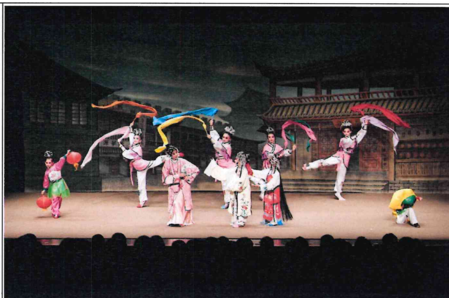
保生文化祭家姓戲_2024. 4. 20保安宮庭園，演出「義女情」