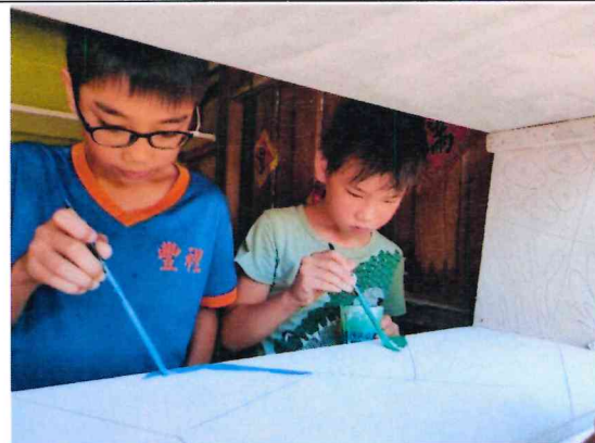
變身社區美化高手