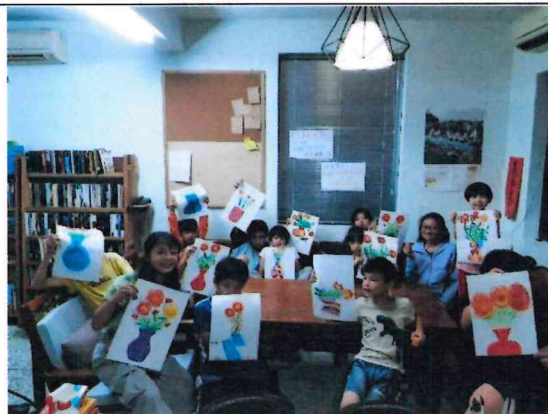
植物採集與插花畫創作