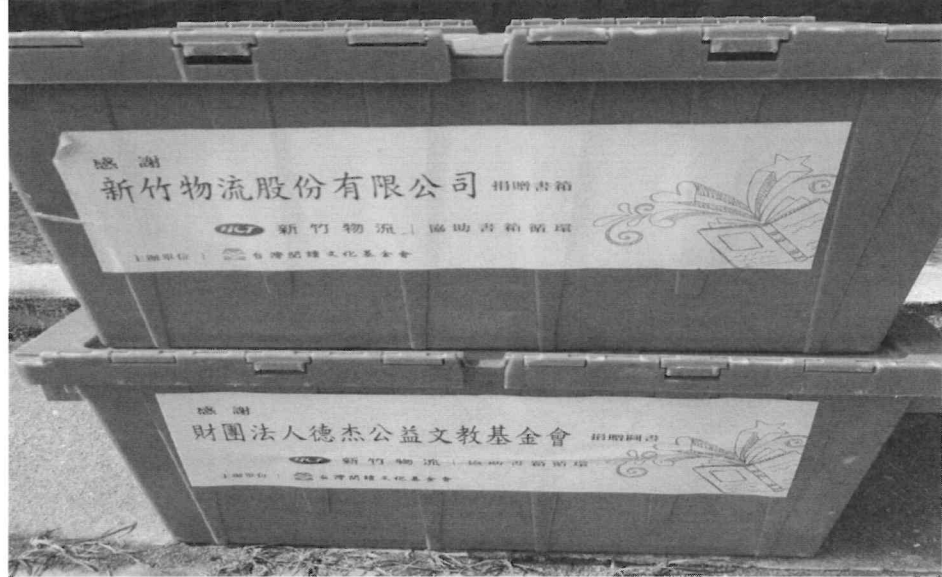
每個書箱外側均註明捐助單位名稱及 Logo 留念致謝