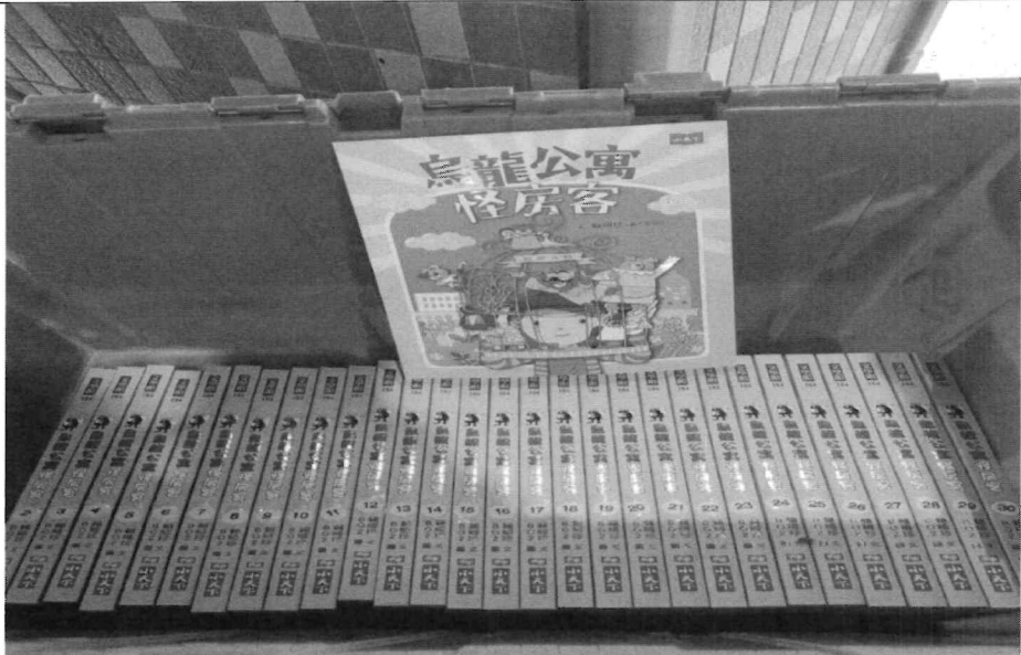
「愛的書庫」共讀書箱