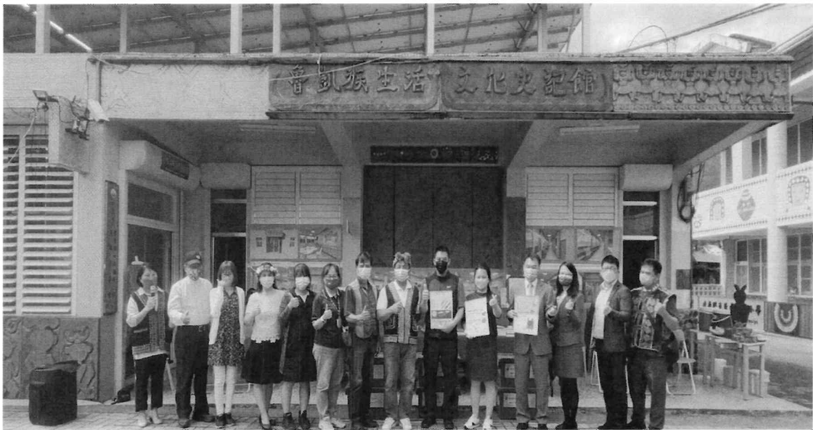
111/10/18台東縣大南國小「愛的書庫」揭牌啟用